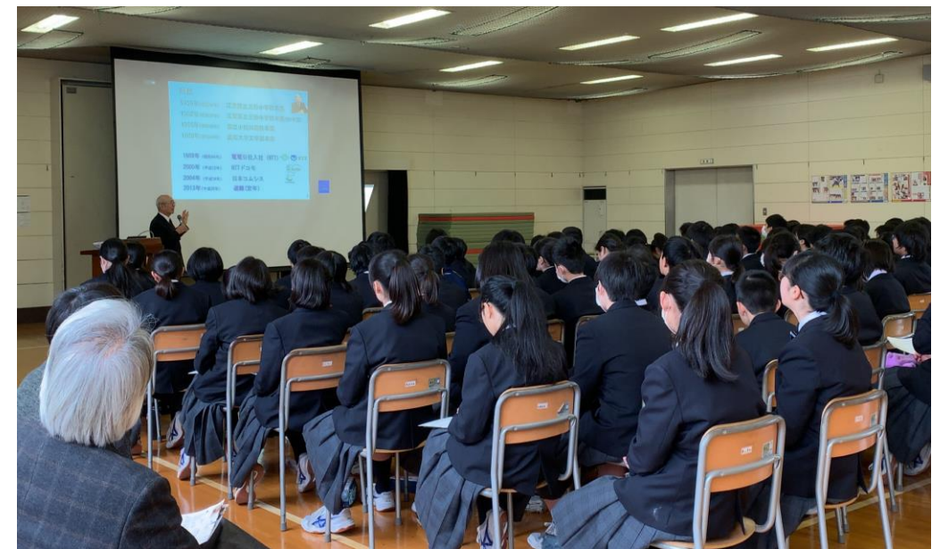
総合学習時間で特別講話