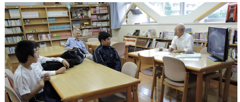
図書室で特別講話