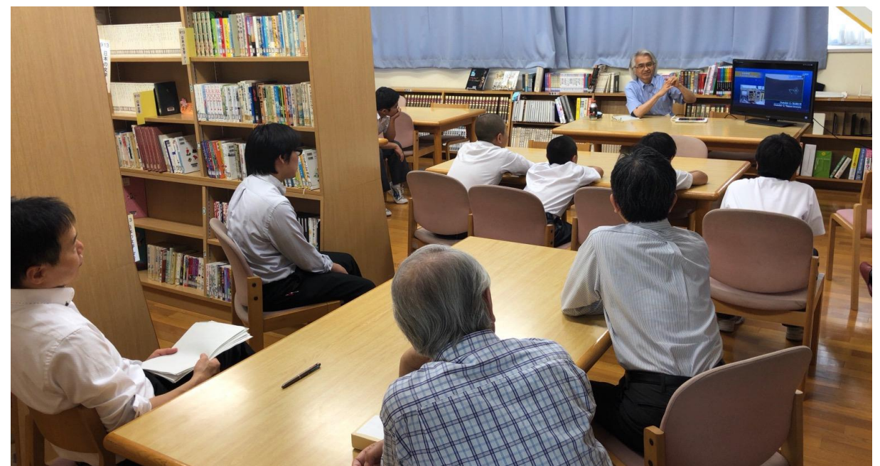
生徒のほか、校長先生なども聴講